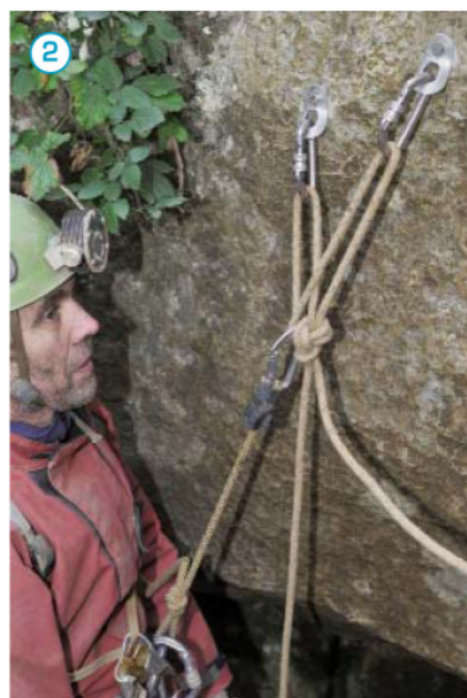
Mise en poids sur la longe au fractionnement